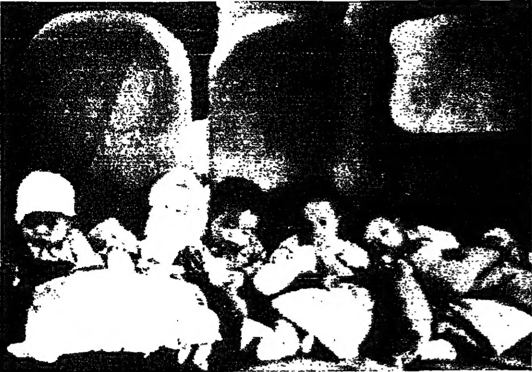
عدد من الاطفال البنائي داخل الطائرة قبل اطلاقها من مطار سايفون. وقد سقطت الطائرة بعد اطلاقها بوقت قصير.

التيكامة الجوية العمومية تصف جوي وعري، قد صعدت هجوما شديدا على « فان رانغ » على بعد ١٧ كيلومترا شرقي سايفون على ساحل بحر الصين الجنوبي. وكانت مصادر عسكرية قد ذكرت في وقت سابق ان القوات الحكومية انسحبت من المنطقة.